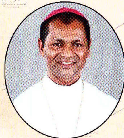
മോസ്റ്റ് റവ. ഡോ. ക്രിസ്തുദാസ് (സഹായ മെത്രാൻ തിരു. ലത്തീൻ അതിരൂപത)